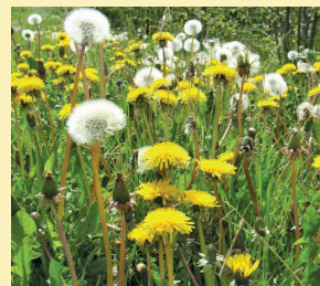
Diente de león

Quite las malezas cuando son pequeñas, en especial cuando tienen menos de tres pies de altura, antes de que las raíces se afirmen.